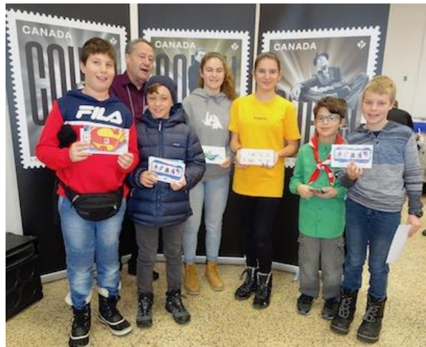
En plus d'un bon d'achat de 2$, les jeunes philatélistes de la relève venus nous visiter ont tous reçu un prix de présence ainsi que des enveloppes de timbres du monde.