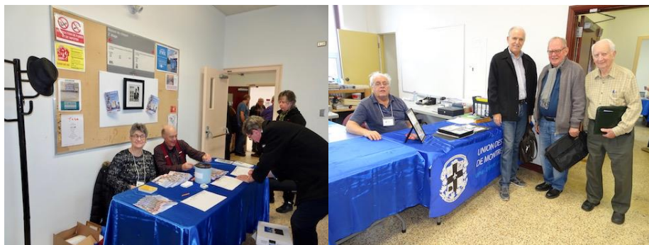
Les visiteurs ont été accueillis chaleureusement par les bénévoles de l'UPM. Ils étaient nombreux à attendre l'ouverture de l'exposition.