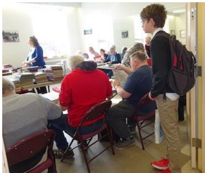
La bourse aux timbres à 10¢ de l'UPM a été prise d'assaut par les philatélistes qui ont dû faire la file et même attendre patiemment qu'une place se libère.