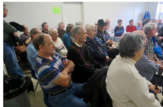
Une quarantaine de personnes ont assisté à la conférence : Les papiers utilisés pour imprimer les timbres canadiens.